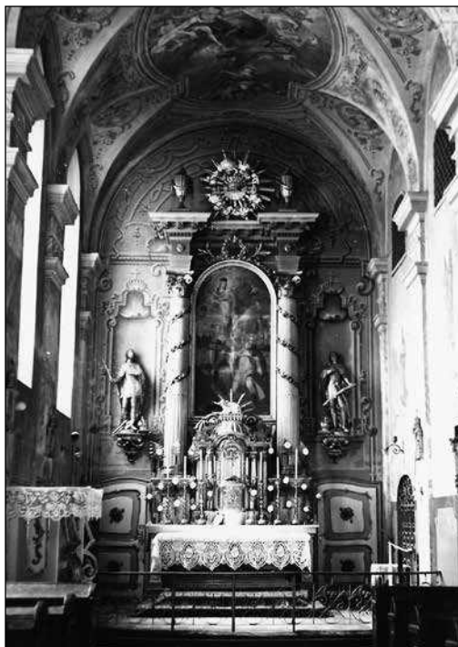
A Szent István tiszteletére emelt veszprémi ferences templom homlokzata és főoltára

tebb áldozatot egy erkölcsileg elítélendő, gyalázatos szándékért politikai szimpátiátüntetésnek tegyék ki.