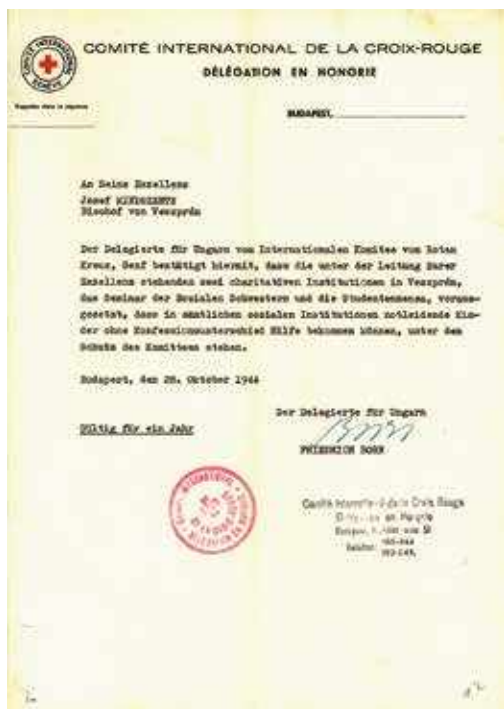
A svájci Friedrich Born, a Nemzetközi Vöröskereszt magyarországi követének igazolása a veszprémi egyházi intézmények védettségéről, 1944. október 28.