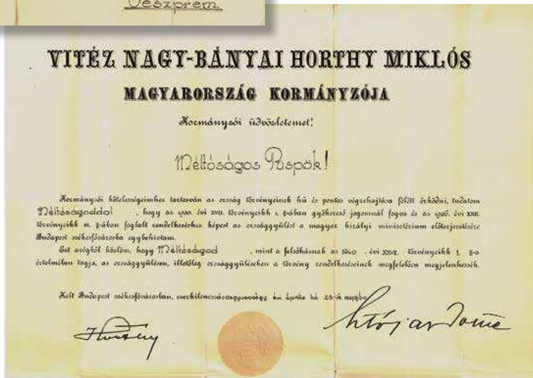
Mindszenty József veszprémi püspöknek, a felsőház tagjának címzett értesítés az országgyűlés összehívásáról, 1944. április 26.