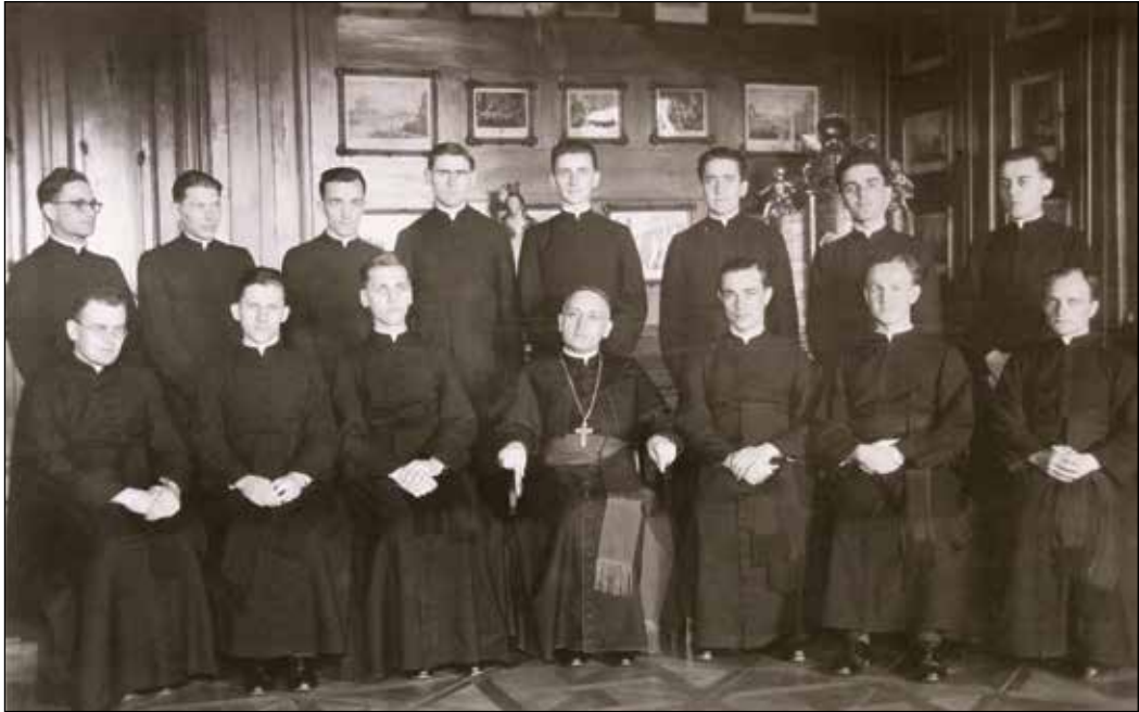
Ötödéves kispapok a veszprémi püspökkel, 1944

A rendőrök be akarták tuszkolni az autóba, ám erre a jelenetre a kispapok a püspök és a rendőrök közé álltak. Végül az ő kíséretükben indult el a furcsa menet: az út egyik oldalán a tizenegy rendőr, a másikon a három letartóztatott és az őket kísérő kispapok. A látvány már önmagában döbbenetes volt, a másfél kilométeres úton nem kellett a püspöknek semmit sem tennie, hogy „felizgassa” a veszprémieket. A kíváncsiskodók elhessegetése csak még nagyobb feltűnést keltett volna, így meglehetősen szép számban érkeztek este hat óra körül a rendőrség épületéhez. Ott Mindszenty áldást osztott, majd papjait és kispapjait hazaküldte. „A menet miatt, amellyel szemben a karhatalom tehetetlen volt, Schiberna kormánybiztos örjöngött és toporzékolt.” 157